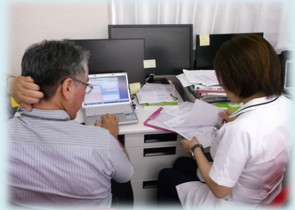
【当日の診療患者さんごとにミーティング】